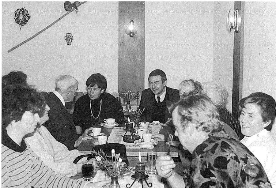
Gemeindetreff in der Jakobus-Stube

Vom Pfarrzentrum aus entfalten die im folgenden genannten Einrichtungen und Gruppierungen unserer Gemeinde ihre Aktivitäten – zum Pfarrzentrum hin sind immer wieder alle eingeladen, um Eucharistie zu feiern und Gemeinde mitzutragen.